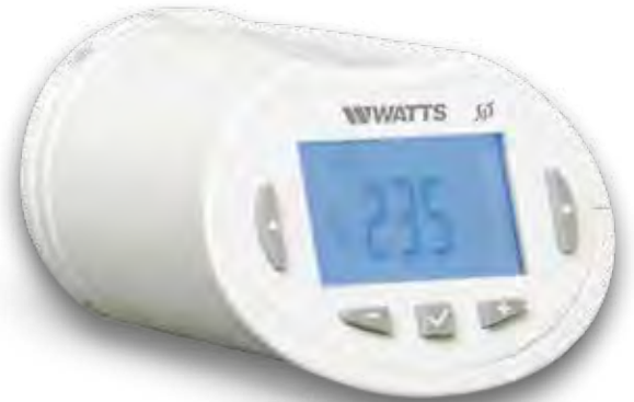
WATTS® Vision BT-TH02 RF