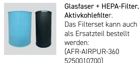
Glasfaser + HEPA-Filter. Aktivkohlefilter. Das Filterset kann auch als Ersatzteil bestellt werden: (AFR-AIRPUR-360 5250010700)